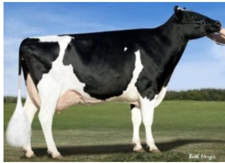
KHW GOLDWYN AIKO ET