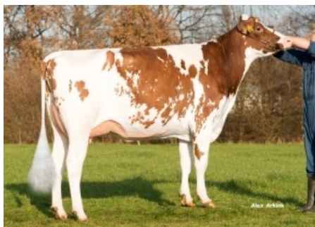
VISSTEIN K&L SV ADERINA RED ET