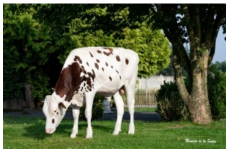
VISSTEIN 3STAR GAVINO RED