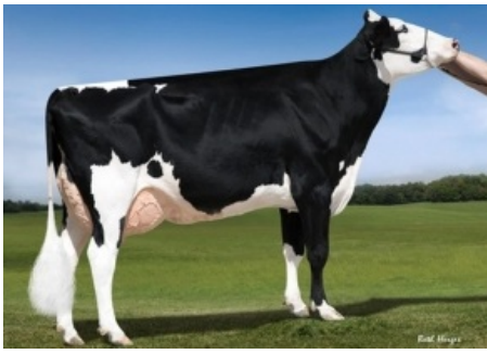
KHW SUPER ADERYN ET