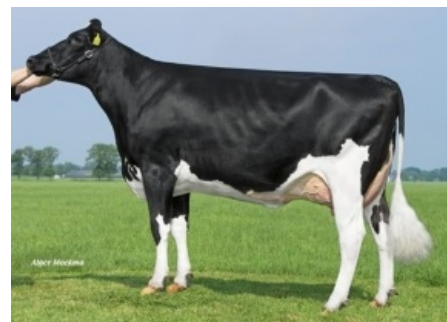
WILLSBRO NUGGET ADERYN ET