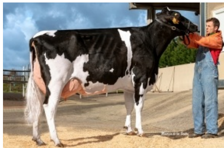
GRILLE MILKTIME 1245 ET Grille S.Coop.Galega - A Coruña