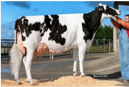
CAAMAÑO GANXABAR 7908 MISSOURI S.A.T. Caamaño XUGA - A Coruña