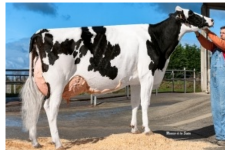
CAAMAÑO GANXABAR 7908 MISSOURI S.A.T. Caamaño XUGA - A Coruña