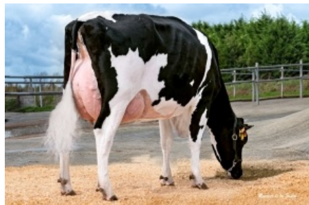
GRILLE MILKTIME 1245 ET Grille S.Coop.Galega - A Coruña