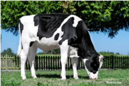
OH MILORD ET