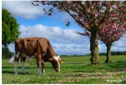
RR 12362 SHEIN RED ET