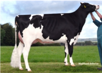
RR ROSE ET