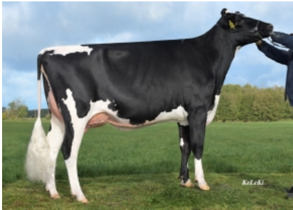
RR RHODODENDR ET