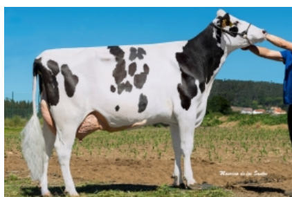
CUNDINS CR1 JEDI FIV ET Cunordam, S.C. - A Coruña Hermana Completa