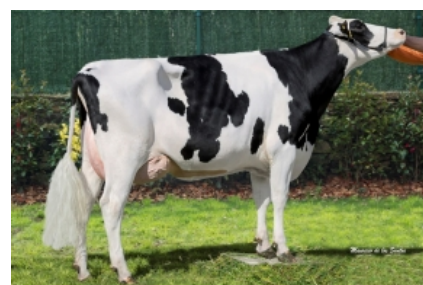
CUNDINS CINTIA RUBICON Cunordam, S.C. - A Coruña Hermana Materna