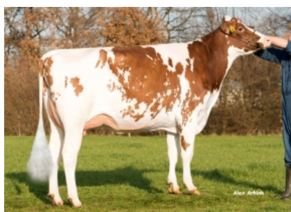
VISSTEIN K&amp;L SV ADERINA RED ET