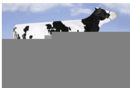
RUSSELLWAY CAMERON PINKY ET