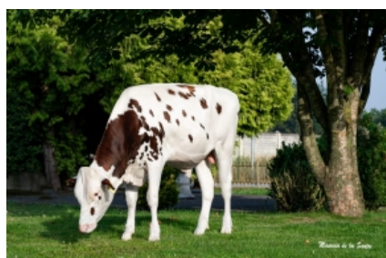
VISSTEIN 3STAR GAVINO RED