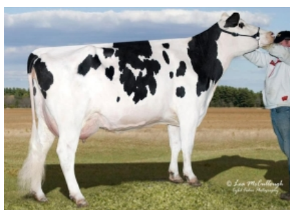
GLO-CREST O MAN PIRATE 4092