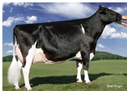
REGANCREST-PR BARBIE ET