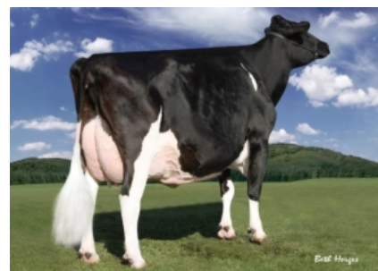
REGANCREST-PR BARBIE ET