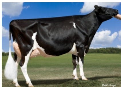
REGANCREST MAC BRITELITE ET