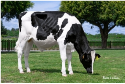
CUNDINS DINAMITA FIV ET