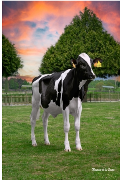
CUNDINS DINAMITA FIV ET