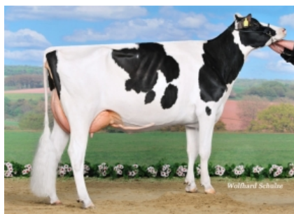
RSB CONNA 5184