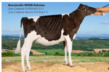
BARONCELLE SNOB SABRINA 5761 Rato, S.C. - Pontevedra