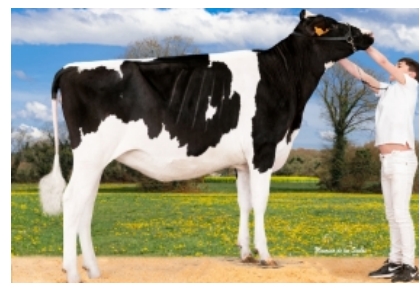
O RUBIO SNOB MANILA O Rubio, S.C. - A Coruña