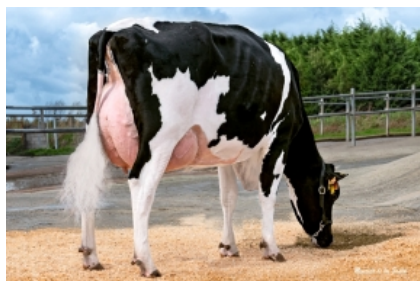
GRILLE MILKTIME 1245 ET Grille S.Coop.Galega - A Coruña