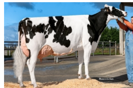
CAAMAÑO GANXABAR 7908 MISSOURI S.A.T. Caamaño XUGA - A Coruña