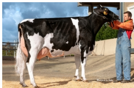
GRILLE MILKTIME 1245 ET Grille S.Coop.Galega - A Coruña