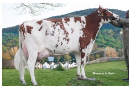
THOS APOLL ALUMETTE P RED ET Ramadería Can Thos, S.L. - Barcelona