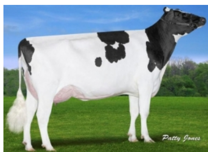
CLAYNOOK FABBY SILVER ET