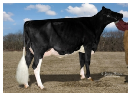
RMW SUPER ARIANE ET