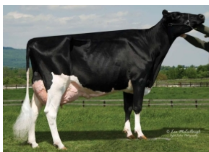
RC-LC GOLDWYN ATM