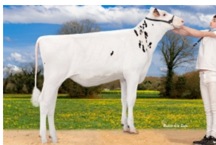
O RUBIO CLARI ET O Rubio, S.C. - A Coruña