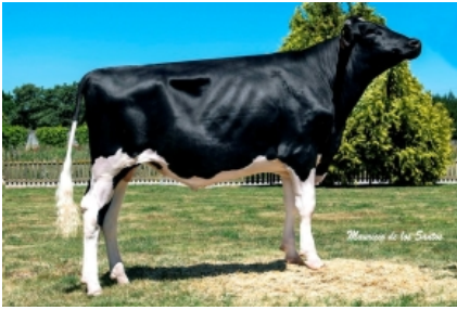
RODASINDE XF DOORMAN DERBI ET