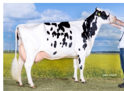
GIessen CINDERELLA 15 ET