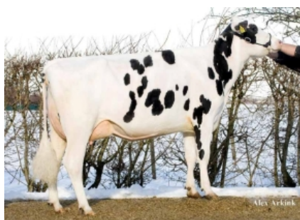
GIessen CINDERELLA 20 TY ET