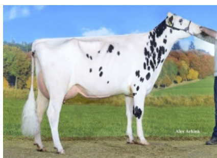
JK DG CINDERE ET