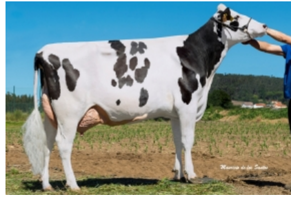
CUNDINS CR1 JEDI FIV ET Granxa Cundin, S.L. - A Coruña