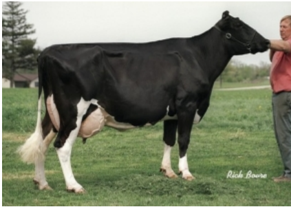
WESSWOOD-HC RUDY MISSY ET