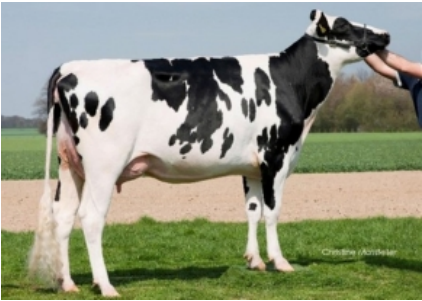
CEH SUPER MELLI