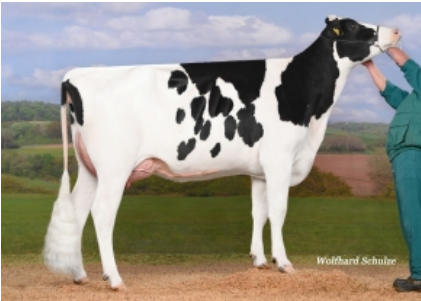
CEH MARLIS ET