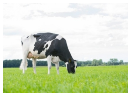
KHE I'M GOOD ET