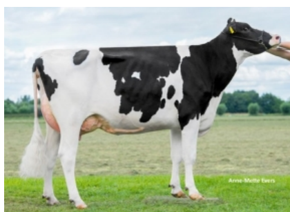
KHE I'M GOOD ET