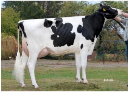
KHE ISOLDE ET