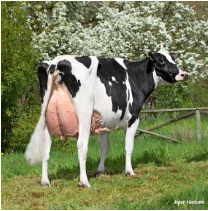
KHE I'M GOOD ET