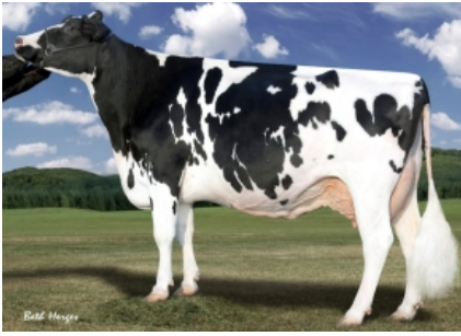
LARCREST OUTSIDE CHAMPAGNE