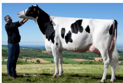
BWH CHANNEL CMP ET Granxa Cundins, S.L. - A Coruña