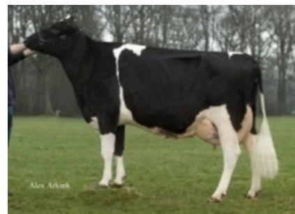
OELHORST COBA 935 ET