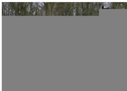
COBA 1 ET