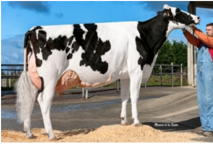
CAAMAÑO GANXABAR 7908 MISSOURI S.A.T. Caamaño XUGA - A Coruña