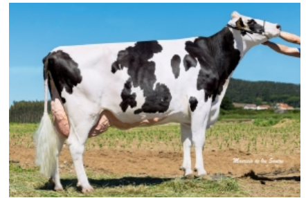
CUNDINS CINDEROXY KINGBOY ET Granxa Cundin, S.L. - A Coruña