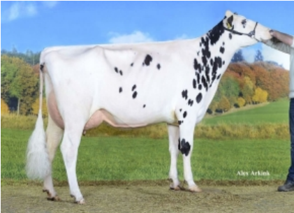
JK DG CINDERE ET