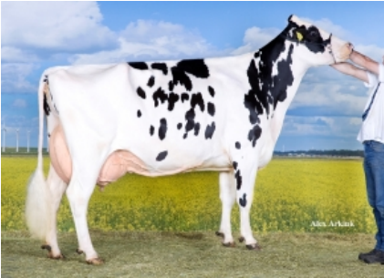
GIESSEN CINDERELLA 15 ET