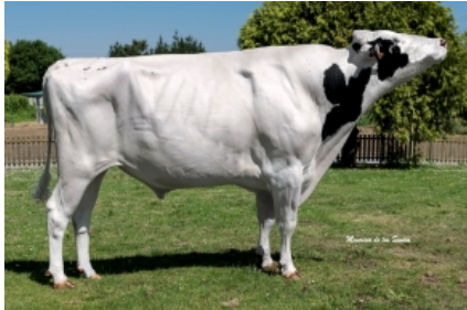
GRILLE MCC CINDER FIV HAPPY ET Grille S.Coop.Galega - A Coruña