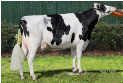
CUNDINS CINTIA RUBICON Granxa Cundin, S.L. - A Coruña