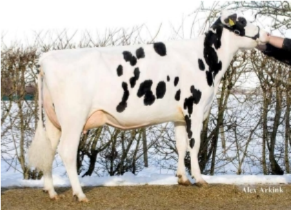
GIESSEN CINDERELLA 20 TY ET