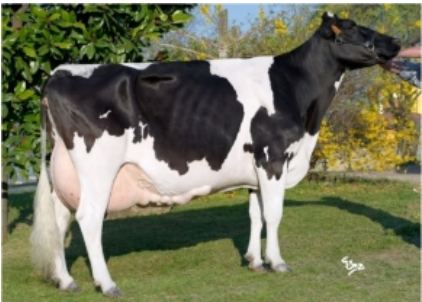
BEL IRON IRENE