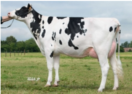
VENDAIRY LIDIA 4