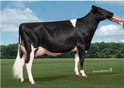
CO-OP SPS PRUDENCE 7079 ET