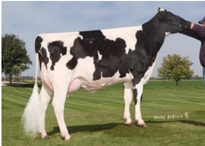
MS M-P DOLCE PRUDENCE ET