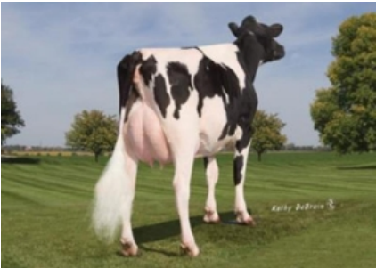
MS M-P DOLCE PRUDENCE ET