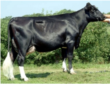
SULLY-G ADDISON OPIUM ET