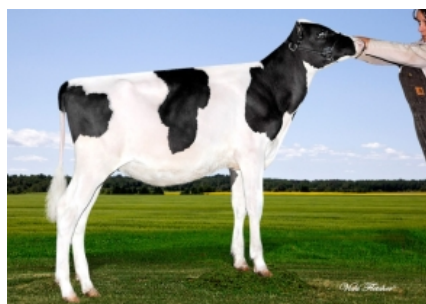
MURRYHOLM BALISTO PENNY ET