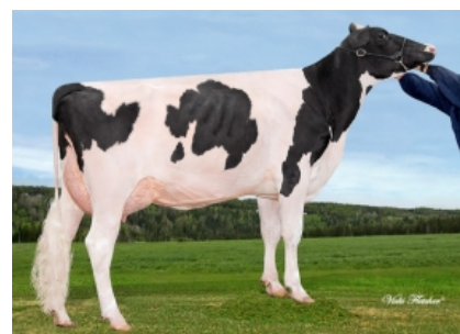
BEAUOISE PLANET PLANE