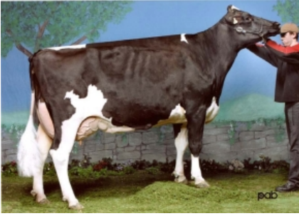
BEAUCOISE INQUIRER CITATION