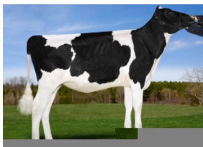
GEN-I-BEQ LEXOR PLAGE