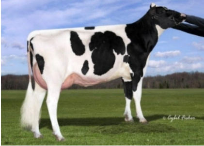
SIEMERS RUBICON D-ROZZA ET