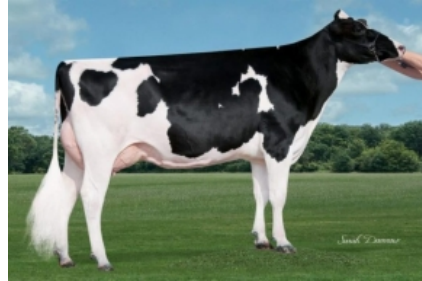
SIEMERS DOORMAN ROZ ET