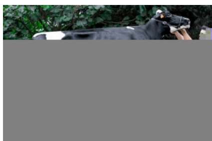
CAMPOLONGO GUAY RETA ET Campolongo, S.C.L. - Lugo