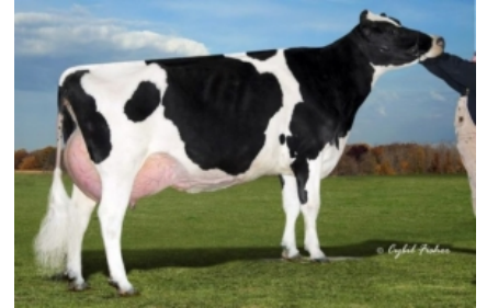
CHERRY CREST MANOMAN ROZ ET