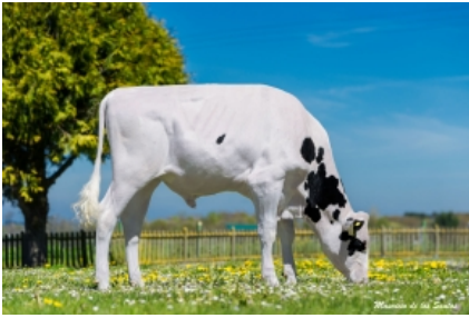
K&L OH ROSSI GUAY