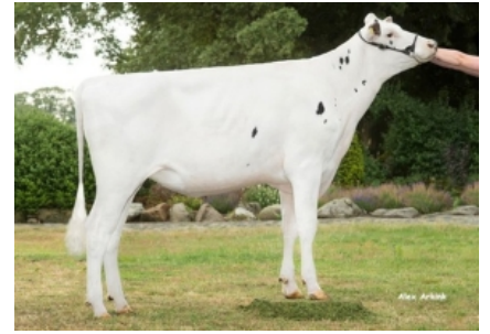
K&L OH ROZELLA Hermana Completa