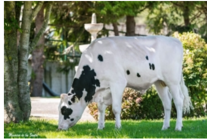
K&L OH ROSSI GUAY