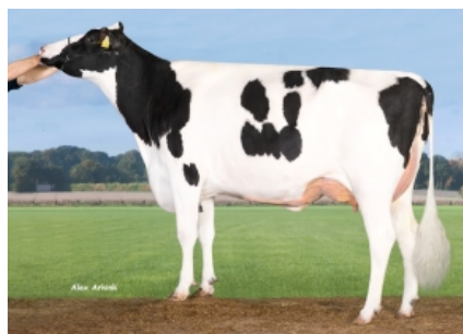
TIRSVAD SNIPER GAMBIA ET