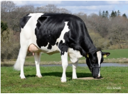
TIRSVAD LIMBO GATSBY