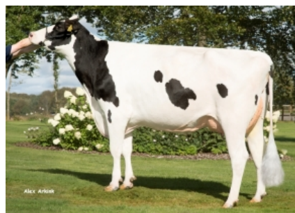
TIRSVAD SILVER GIGA-STAR- ET