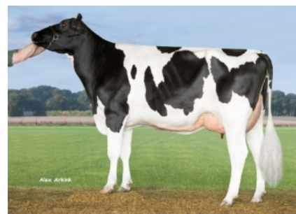
TIRSVAD MASSEY GAGA ET