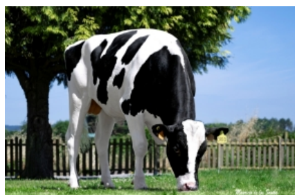
ROMEPEN OREO ET