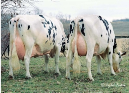
GOLD-N-OAKS DUSTER CINDY