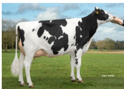
TIRSVAD K&L RIVETING MAGNOLIA ET