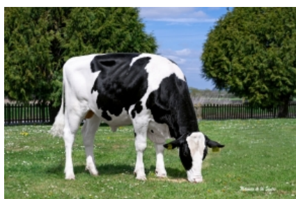
3STAR OH MAGNOMAN