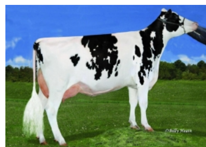
MS GOLD-N-OAK MAYBALINE ET