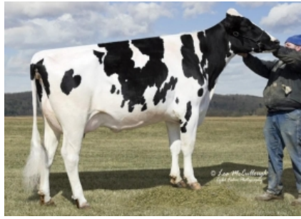
GOLD-N-OAKS S MARBELLA ET