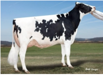
GOLD-N-OAKS ARABELL 1765 ET