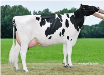
AMSEL Hermana de la Madre