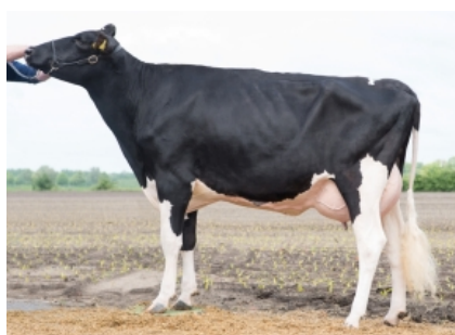
R MALI ET