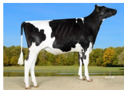
WILDER MOND ET Hermana Completa