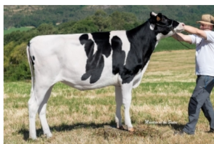
KINTEIRO XF IMAX FABULA ET