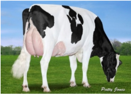
VIEW-HOME MCC FOUND ET