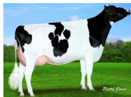
VIEW-HOME MCC FOUND ET