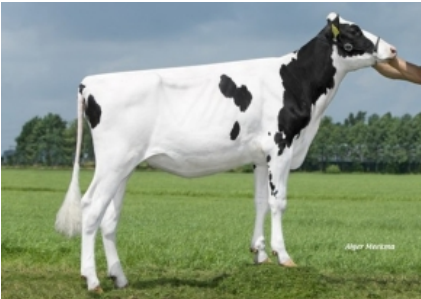
K&L SH FLEUR ET