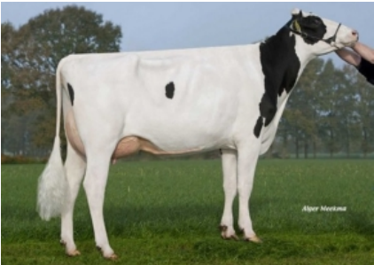
FG POLICY 1 ET