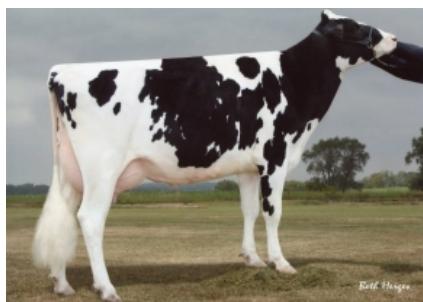
GLEN-VALLEY SHOTT CASSIA ET