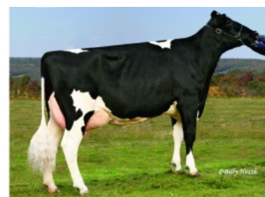
COOKIECUTTER GLD HOLLER ET