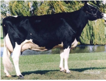
SNOW-N DENISES DELIA