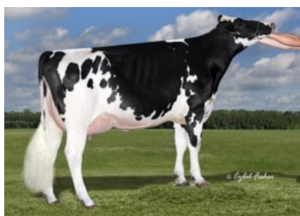
COOKIECUTTER EPIC HAZEL ET