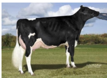
COOKIECUTTER MOM HALO-ET