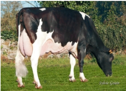
BOS CANEDA NAOMI STORM ET S.A.T. Candesa - A Coruña