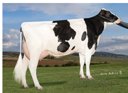
PEN-COL ROBUST HARP ET