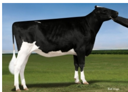
PINE-TREE 6660 BAND 7234 ET