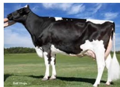
SCREAMING VIS R HEAVEN ET