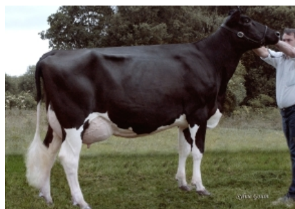
BOS XERCAS CAV DISA BEST ET