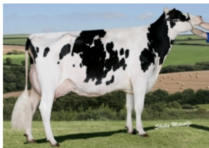
WILLSBRO GOLD GHOST ET