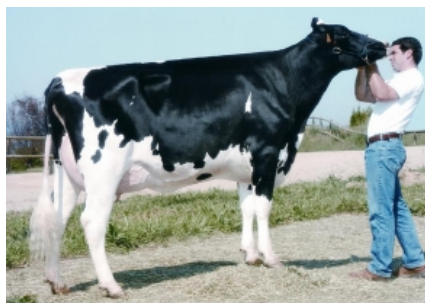
BOS IGNITER VALIOSA ET