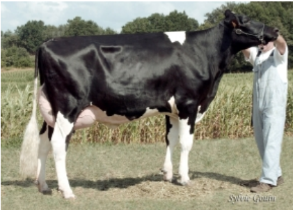
OUTEIRO LHEROS BAMBI