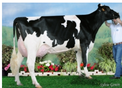
BOS TOYSTORY WANDA ET