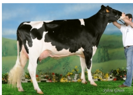
BOS JET STREAM FIONA ET