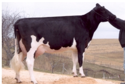
MISS MISCHIEF ET