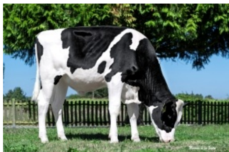
OH MILORD ET