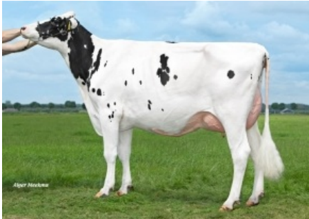
MOLENKAMP GIGABALL GLASSES 3 Molenkamp Holstein - Holanda