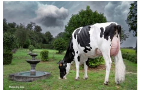
TASIL GIGABALL 2990 Tasil, S.C. - Pontevedra