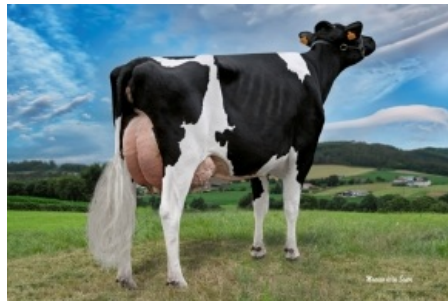
PEXEGUEIROS GIGABALL BALIÑA Granxa Pexegueiros, S.L. - A Coruña