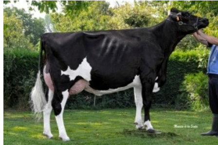
MARTIÑO GIGABALL 4740 Casa Martiño, S.C. - Lugo