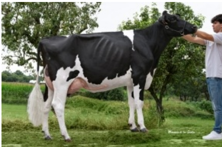
CANCELA GIGABALL 0202 Ganadería Casa Cancela - Lugo