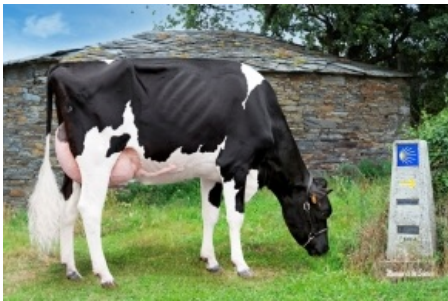
CANCELA GIGABALL 0202 Ganadería Casa Cancela - Lugo