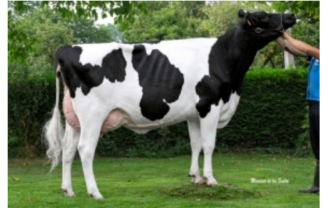
MARTIÑO GIGABALL 4746 Casa Martiño, S.C. - Lugo