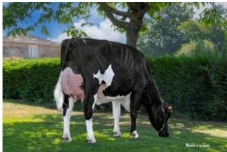
MARTIÑO GIGABALL 4740 Casa Martiño, S.C. - Lugo