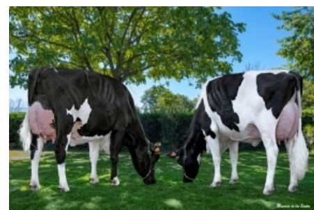
MARTIÑO GIGABALL 4740 & MARTIÑO GIGABALL 4746 Casa Martiño, S.C. - Lugo