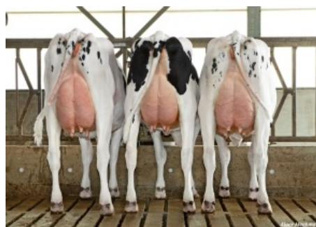
HIJAS DE GIGABALL - HOLANDA Molenkamp Holstein - Holanda