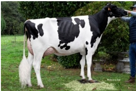
TASIL GIGABALL 2990 Tasil, S.C. - Pontevedra