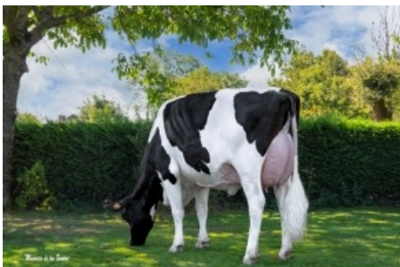
MARTIÑO GIGABALL 4746 Casa Martiño, S.C. - Lugo