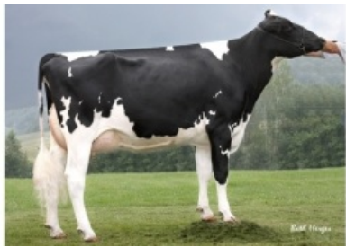
FARNEAR-TBR BAILEY ET