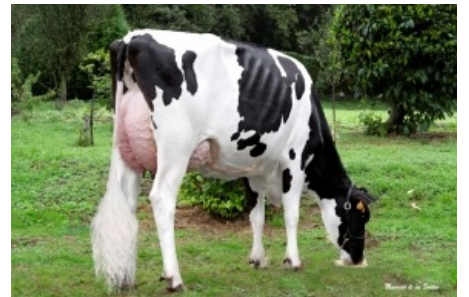
TASIL GIGABALL 2990 Tasil, S.C. - Pontevedra