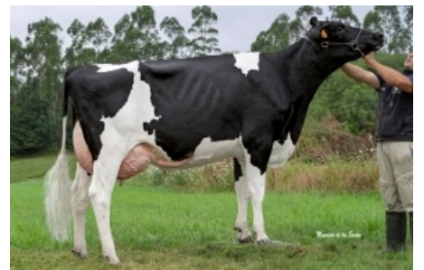
PEXEGUEIROS GIGABALL BALIÑA Granxa Pexegueiros, S.L. - A Coruña