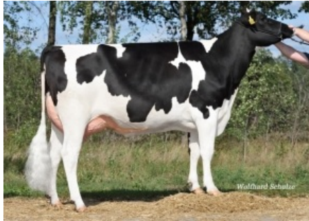
WEH BRASILIA ET