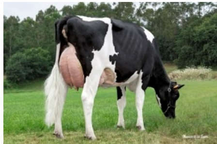
PEXEGUEIROS GIGABALL BALIÑA Granxa Pexegueiros, S.L. - A Coruña