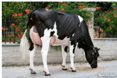
CANCELA GIGABALL 0202 Ganadería Casa Cancela - Lugo