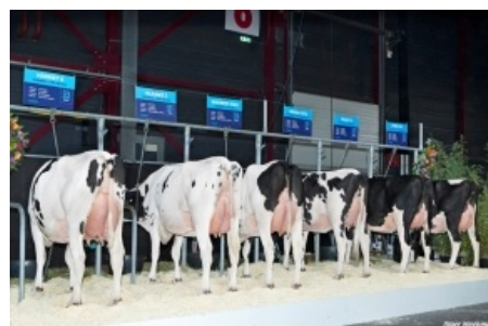
GRUPO PROGENIE GIGABALL - HOLANDA Holland Holstein Show NOVIEMBRE 2024 - Holanda