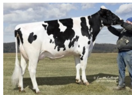
GOLD-N-OAKS S MARBELLA ET