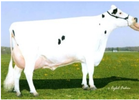
GOLD-N-OAKS MORTY MALIBU ET