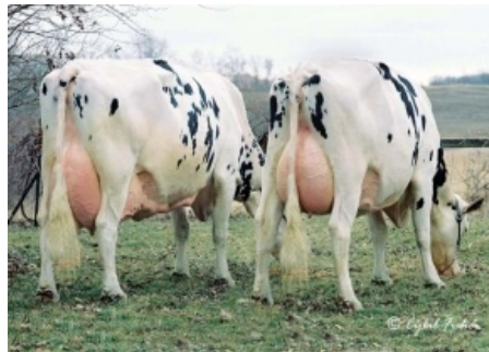
GOLD-N-OAKS DUSTER CINDY