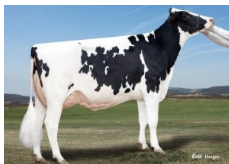
GOLD-N-OAKS ARABELL 1765 ET