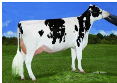
MS GOLD-N-OAK MAYBALINE ET