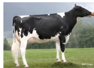
FARNEAR-TBR BAILEY ET