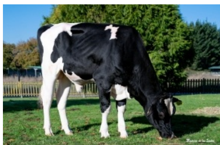
DYKSTER 3STAR GLADITORE