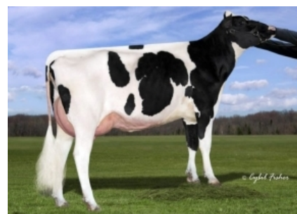
SIEMERS RUBICON D-ROZZA ET