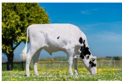
K&L OH ROSSI GUAY