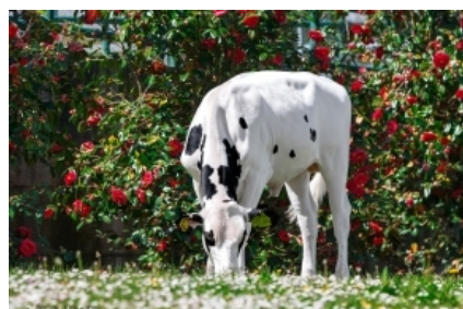
K&L OH ROSSI GUAY