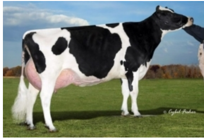
CHERRY CREST MANOMAN ROZ ET