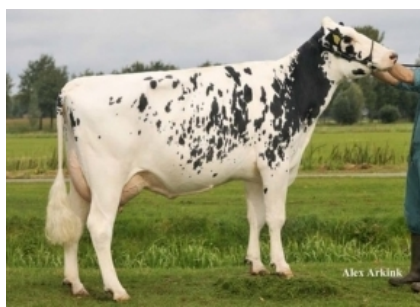
WILLEMSHOEVE RITA 420 Trisaïeule Maternelle