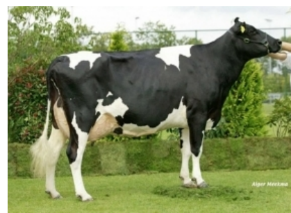
WILLEMSHOEVE RITA 233A