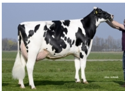
WILLEMSHOEVE RITA 3248 ET