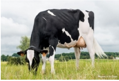
SANDE BANDIDO RUBIA S.A.T. Casa Sande - Lugo BANDIDO x CHAMOSO