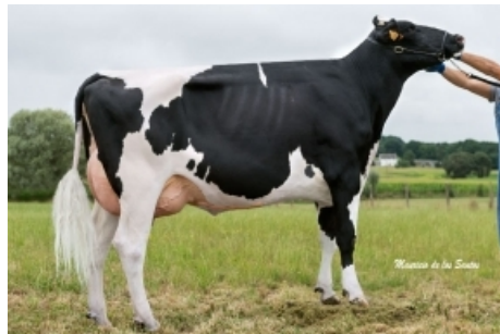
SANDE BANDIDO RUBIA S.A.T. Casa Sande - Lugo BANDIDO x CHAMOSO