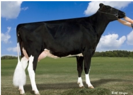
FARNEAR GOLD BANJI