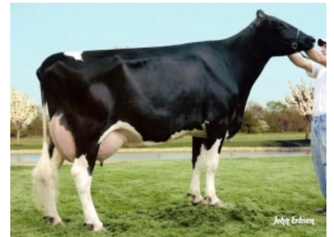
FARNEAR BLIZZARD BLAZE