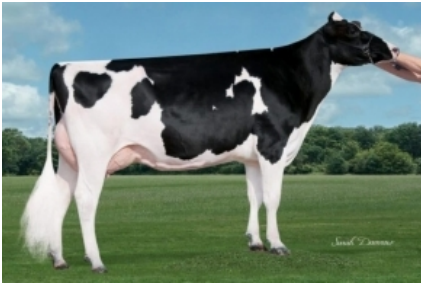
SIEMERS DOORMAN ROZ ET