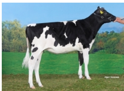
DG JK SIMMY