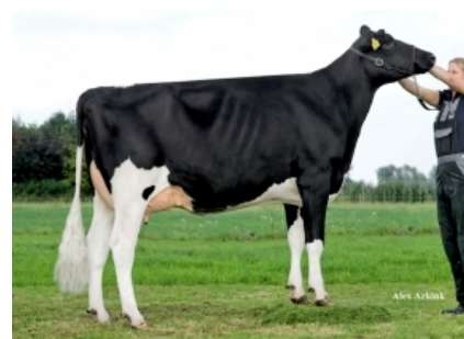
DG JK EDER SILLY