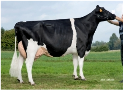
ALL NUREBAXTER SILVY ET